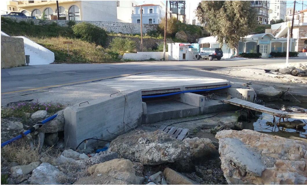
Φωτ. 7: Τεχνικό εκβολής ομβρίων σε επέκταση σκάλας στην δυτική πλευρά του Επαρχείου