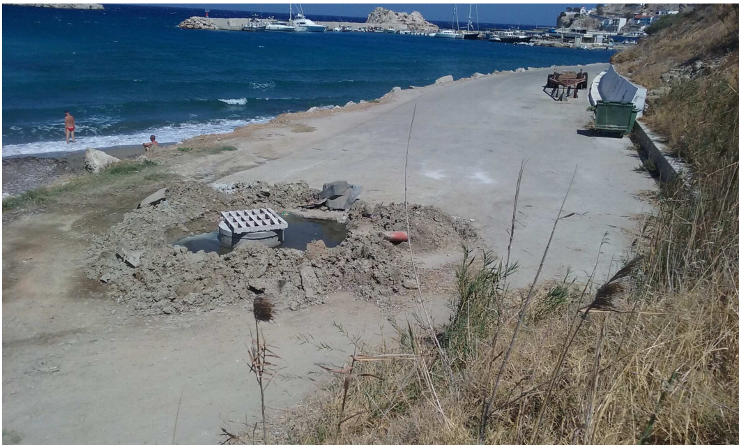
Φωτ. 4 : Υπερχειλισμένο το 2ο φρεάτιο στην αρχή της ασφαλτοστρωμένης παραλιακής οδού