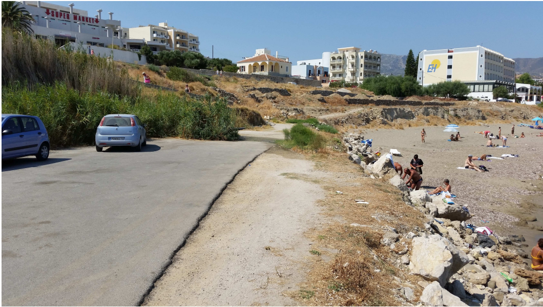
Φωτ. 5 : Υπερχειλίζον 2ο φρεάτιο στην αρχή της ασφαλτοστρωμένης παραλιακής οδού κοντά στους κολυμβητές στην παραλία