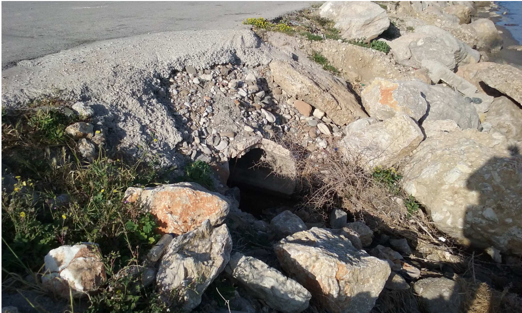
Φωτ. 6 : Εκβολή αγωγού ομβρίων στα 698-700 μέτρα από την αρχή της παραλιακής οδού