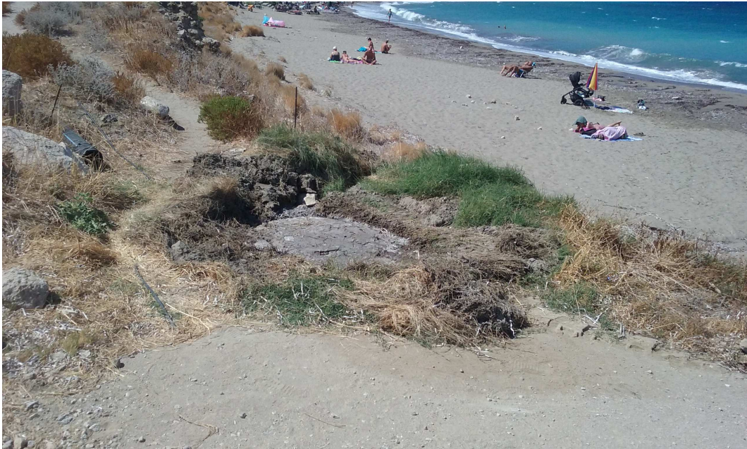
Φωτ. 3: Άποψη πρώτου υπερχειλίζοντος φρεατίου στην αρχή της ασφαλτοστρωμένης παραλιακής οδού