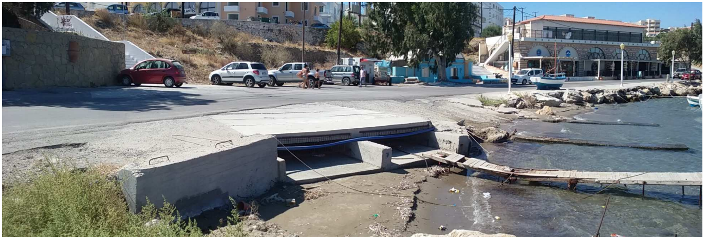
Φωτ. 8: Ευρύτερη περιοχή στο τεχνικό εκβολής ομβρίων σε επέκταση σκάλας στην δυτική πλευρά του Επαρχείου